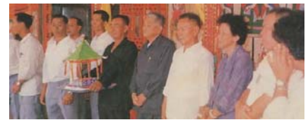
攬榜公及緣首拜神儀式