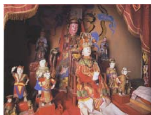
天后娘娘及金童玉女

天后宮重修後，至今亦過百年，因經常保養粉飾，雅潔依然，綠瓦紅牆，簷椽飛喙，甚有古風，簷下雕像乃石灣巧如璋塑製，神仙故事中的人物，意態悠然，栩栩如生。門前一