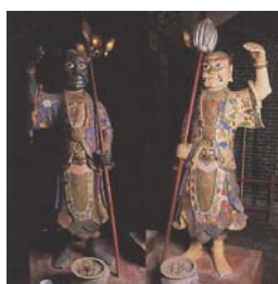
天后娘娘座前左朝江右望海

到感召，有了預知休咎的能力，能為鄉人治病、占卜，造福鄉里。十三歲那年，玄通老道士傳授她玄妙的密法，十六歲時，默娘跟女伴在井邊遊戲，突然出現一個神仙，其他他人被嚇得拔腳就跑，唯有林默娘雙腿跪下，瞻望神仙，神仙將銅符交她，之後，默娘就修得一身法力，常常駕雲飛渡大海，救護遇難船隻。以海為生的漁民，難免有遇到大風大浪的時刻，覆舟溺斃更是時有所聞，遇難逃歸的人都說，落水時恍惚間看到一名紅衣少女，駕馭一張竹蓆，在海上往來，把遇溺者救起，送到海邊，少女就不見了；而那些獲救的人回家後，才知道自己的家人求過默娘，默娘答允拯救。村民感於她的恩德，