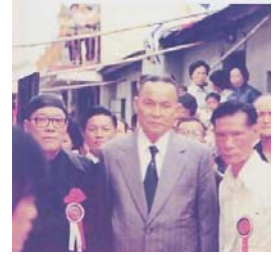
迎接正副攬榜往天后宮

每年做大戲的傳統維持百多年，1936 年政局已經動盪，未幾中日戰爭爆發，民生艱苦，就沒有再做了。戰後百廢待興，吉澳民生也逐漸恢復。可是，由於大水淹至，戲棚的所有用料、工具等盪然無存，有人建議停辦神